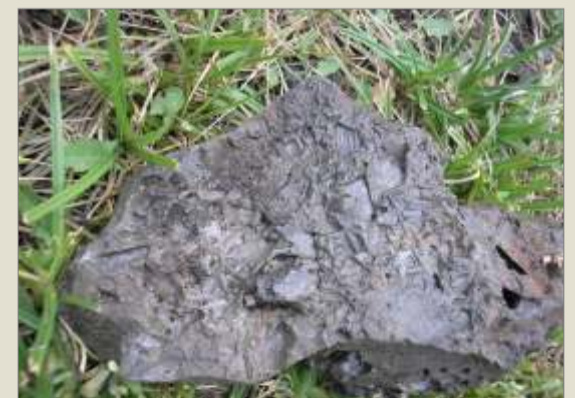
Żelazo hutnicze z odciskami grudkami węgla drzewnego.