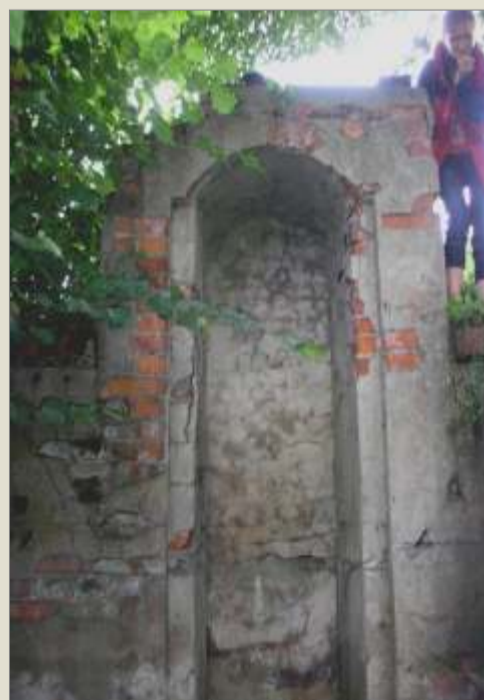
Urządzenie spustowe na grobli stawu hutniczego w Chwostku usytuowane w miejscu wlotu do dawnego kanału roboczego.