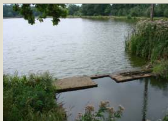
Staw pohutniczy w Dołach koło Boronowa współcześnie nie wykorzystywany jako staw rybny.