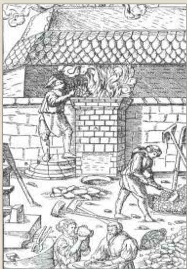
Wytapianie żelaza w dymarce wg Georgiusa Agricoli.

Dalszy rozwój hutnictwa wiązał się ze zwiększeniem wydajności i przyspieszeniem procesu przetwarzania rudy w żelazo. Pojawiły się pierwsze kuźnie wyposażone w piece, tzw. dymarki . Do nowych pieców powietrze dostarczano już z miechów napędzanych energią płynącej wody, co w znacznym stopniu ułatwiło produkcję żelaza. W dymarce uzyskiwano wysokie temperatury, które powodowały powstanie płynnego surowca o lepszej niż dawniej jakości. W celu uzyskania czystego żelaza wytapiano je powtórnie w procesie zwanym wieńcem .