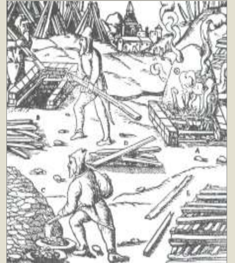
Wypalanie węgla drzewnego wg Georgiusa Agricoli.

Aby móc przetworzyć wydobytą rudę w żelazo wymagane było uzyskanie wysokiej temperatury. Dawny hutnik zakładał ognisko w głębokim dole ziemnym, w pobliżu złoża rudy oraz w pobliżu lasu, aby mieć na miejscu dostępowo do drewna. Powietrze było dostarczane wielkimi miechami, które napędzane były siłami ludzkimi. Uzyskane żelazo miało porowatą strukturę i tylko przez kucie można było usunąć z niego węgiel.