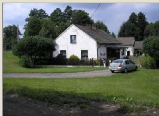
Adaptowany na cele mieszkalne budynek hutniczy w Chwostku - Kuźnicy. Z lewej strony, między domem a skarpem, znajduje się pozostałość kamiennego kanału roboczego.

Dalszy rozwój hutnictwa wiązał się ze zwiększeniem wydajności i przyspieszeniem procesu przetwarzania rudy w żelazo. Pojawiły się pierwsze kuźnie wyposażone w piece, tzw. dymarki . Do nowych pieców powietrze dostarczano już z miechów napędzanych energią płynącej wody, co w znacznym stopniu ułatwiło produkcję żelaza. W dymarce uzyskiwano wysokie temperatury, które powodowały powstanie płynnego surowca o lepszej niż dawniej jakości. W celu uzyskania czystego żelaza wytapiano je powtórnie w procesie zwanym wieńcem .